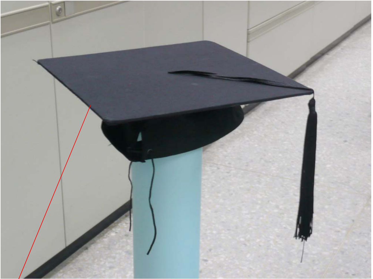
學生學士帽 (整頂黑色)