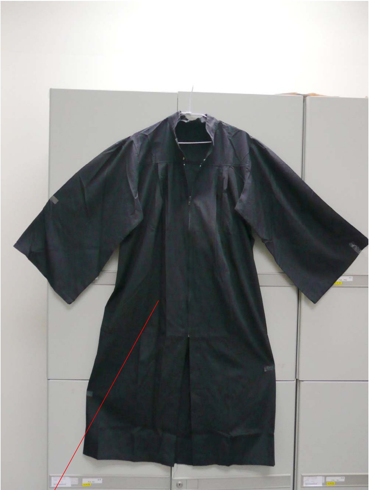
學生學士服(整件黑色)