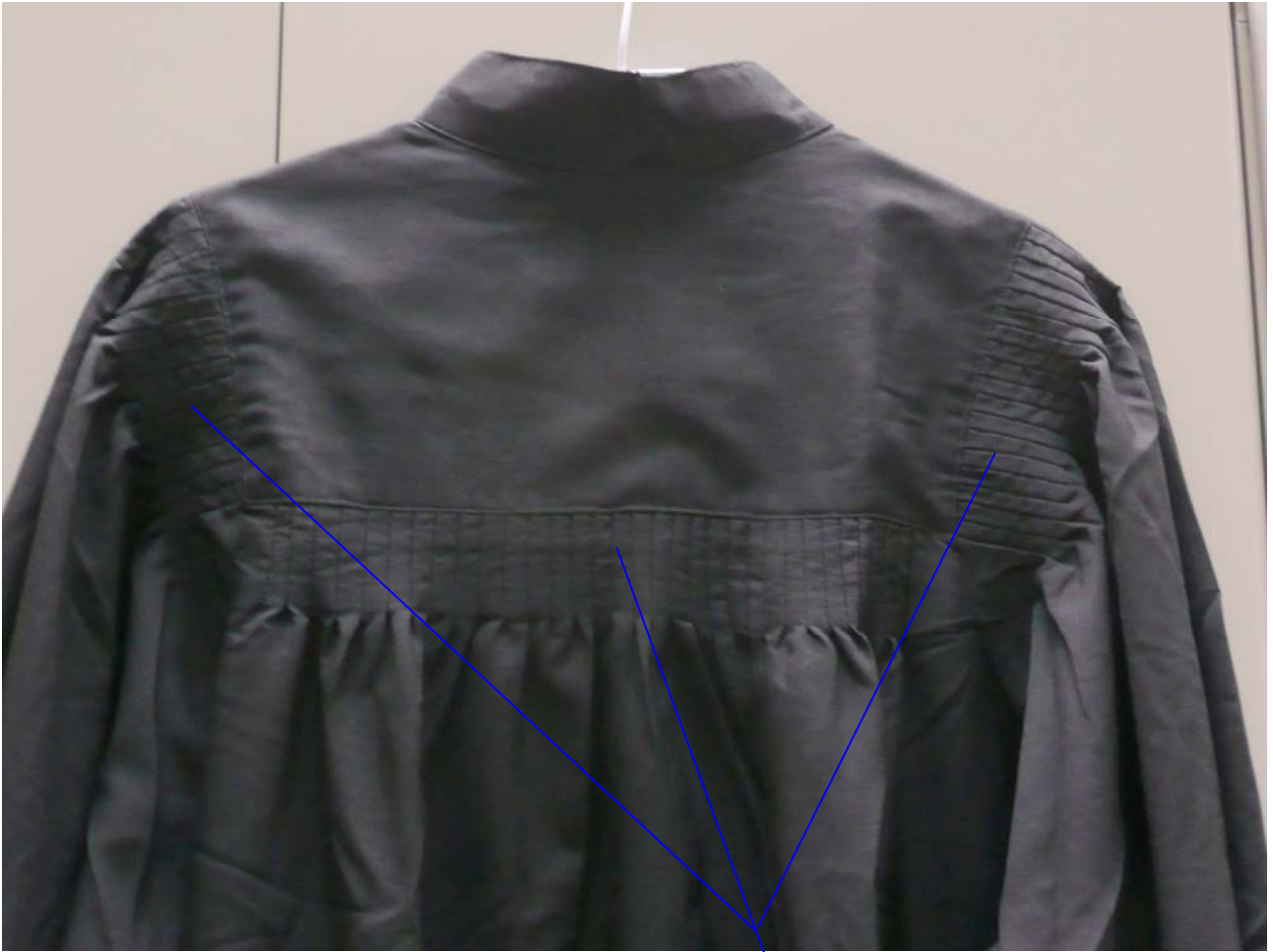
學生碩士服整件黑色不分學院，但是注意衣服上要有(車縫摺疊邊)